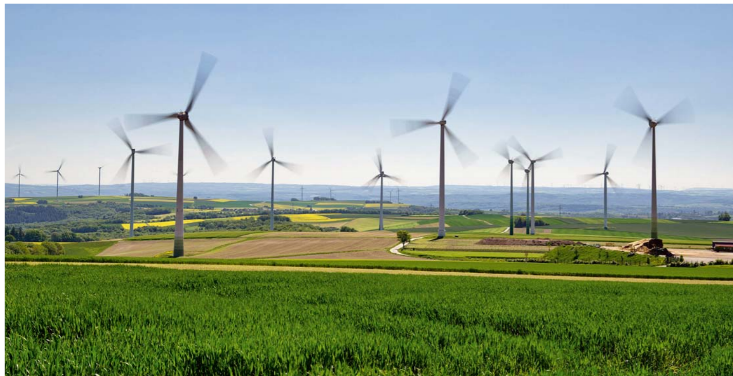
Erneuerbarer Gewinn Windräder von Vestas drehen sich im Windpark von Clearvise bei Düngenheim. Mit beiden Aktien können Nachhaltigkeitsfonds im Ranking punkten